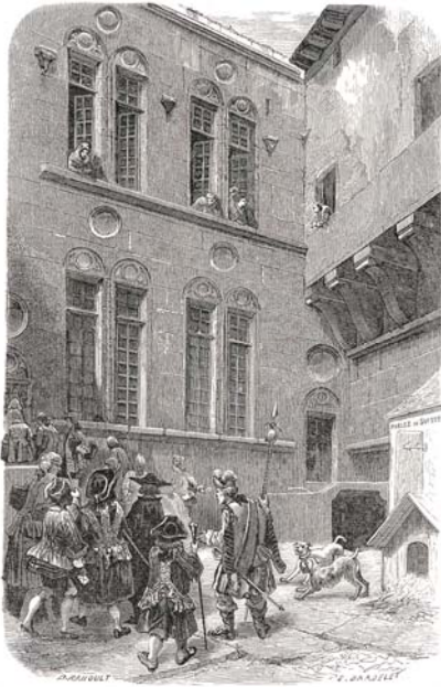
La cour des hôtels Croy, Chasnel et Bücher

Dessin provenant de l'ouvrage « Grenoble Malhérou »