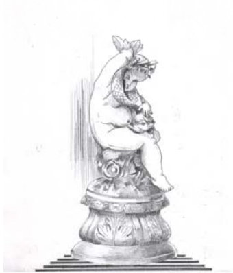
Putto de la fontaine de la place Victor Hugo à Grenoble Dessin de Guy Jouffrey