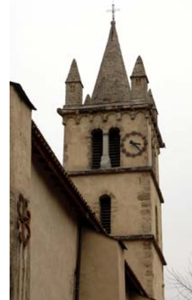
Eglise de Vif