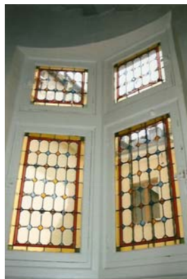
L'escalier à vis et les vitraux sur la cour intérieure du 11 grande rue

Merci à Claude Chave de nous avoir ouvert cette cour et commenté ce lieu qui possède une très intéressante architecture du XVII e siècle.