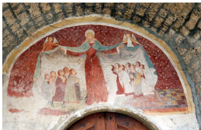
Fresque de Notre-Dame au manteau, porche de l'église de Genevrey de Vif