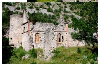
Les ruines du château de la famille de Bonne à Diguières

L'équipe d'une dizaine de personnes effectue des recherches et a conçu un circuit pédestre ; il sera précédé d'un diaporama en classe retraçant la vie du Connétable dont le rôle dépasse largement la province du Dauphiné. Homme de guerre, habile stratège et fin diplomate, il devient riche et redouté dans la période troublée des guerres de religion et de l'affirmation de la monarchie. Lorsqu'il reçoit le titre prestigieux de connétable après avoir abjuré le protestantisme dans la collégiale Saint-André, il devient l'homme le plus puissant du royaume après le roi de France. Il passe beaucoup de temps dans notre région, au château de Vizille et à Grenoble agrandissant à plusieurs reprises le Palais delphinal. Lesdiguières garantit ainsi la