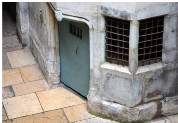
Porte dans la cour 10 rue Chenoise donnant accès aux appartements