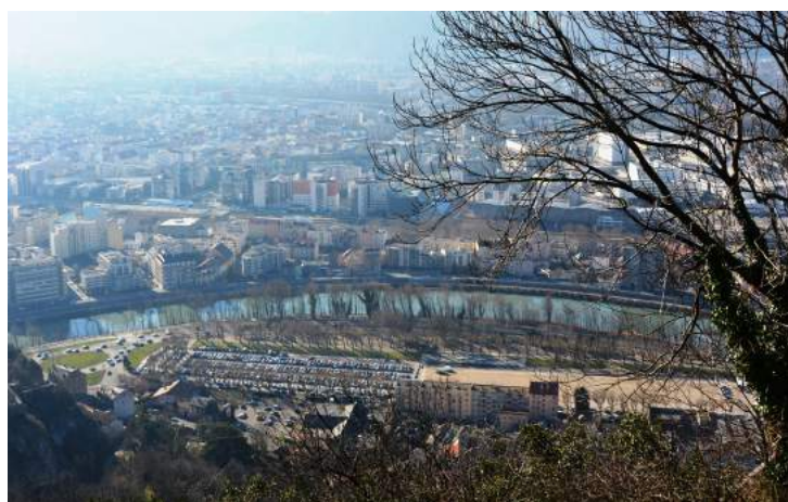
L'Esplanade aujourd'hui, vue de la Bastille