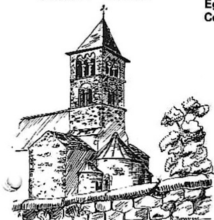
Le chevet de l'église de Mayra, avec son minuscule transept et ses absidioles. (croquis R. Borneque)

Inaugurant une nouvelle formule, nous partions ce jour-là pour la journée. A Mésages, deux églises, souvent confondues par les guides, se dressent à proximité l'une de l'autre. Blottie contre la pente, Saint Sauveur, chapelle paroissiale, offre une silhouette pittoresque, surtout par son clocher incliné sur l'abside, signe de tassements qui ont gravement menacé le monument dont toute la partie orientale repose sur des terres rapportées, peu stables. De récents travaux de restauration, outre un très utile nettoyage des murs, ont ceinturé toute l'église de béton armé (invisible), fournissant au clocher un ancrage qui semble écarter pour longtemps tout danger.